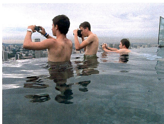
Die Velofahrer fotografieren die Aussicht vom Marina Bay Sand aus. 😊

Ich möchte mich ganz herzlich bei euch allen für die tolle Unterstützung und das Interesse bedanken!!!